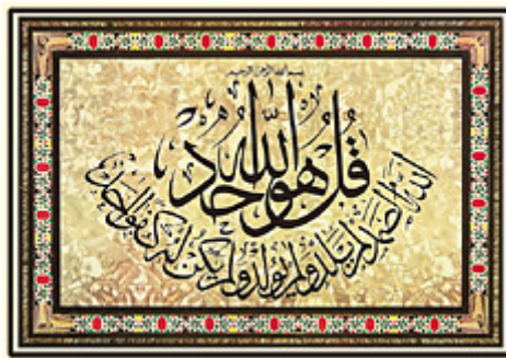
บทที่ 112 ของพระคัมภีร์กุรอานซึ่งจารึก เป็นภาษาอารบิกด้วยลายมือที่งดงาม

ชาวมุสลิมเชื่อในพระเจ้าผู้เป็นเจ้าที่ไม่มีสิ่งใดมาเปรียบเทียบกับได้ มีเอกลักษณ์เด่นพิเศษเพียงพระองค์เดียว ผู้ซึ่งไม่มีพระบุตรหรือบิวาร และไม่มีผู้ใดมีสิทธิ์ที่จะได้รับการสักการะบูชา นอกจากพระองค์เพียงผู้เดียวเท่านั้น พระองค์ทรงเป็นพระเจ้าที่แท้จริง และพระเจ้าองค์อื่นล้วนเป็นสิ่งสักการะจอมปลอม พระองค์ทรงมีพระนามที่ไพเราะ และมีคุณลักษณะอันเพียบพร้อมงดงามไม่มีผู้ใดจะมาแบ่งความเป็นพระเจ้าผู้เป็นเจ้าของพระองค์ หรือคุณลักษณะอันสมบูรณ์ของพระองค์ไปได้ ในพระคัมภีร์กุรอาน พระเจ้าผู้เป็นเจ้าทรงอรรถาธิบายตัวของพระองค์เองไว้ดังนี้: